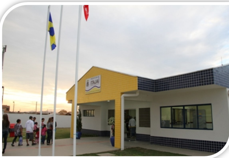
CEI Maria da Glória Stringari